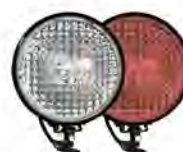
фары на СИМ